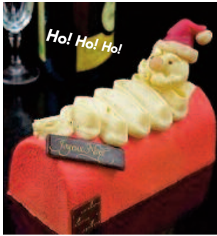
Ho! Ho! Ho! sans gluten *