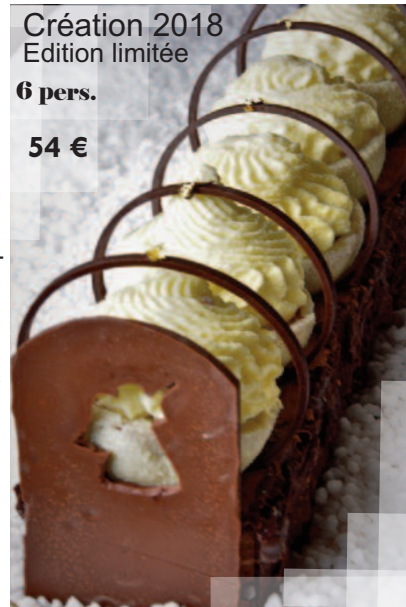
Création 2018 Edition limitée