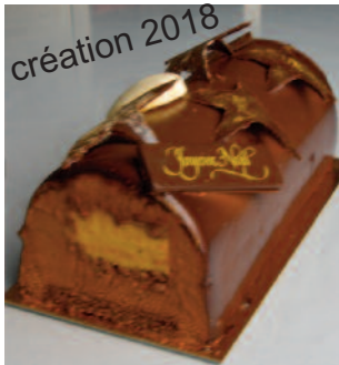
Coeur caraïbe sans gluten *