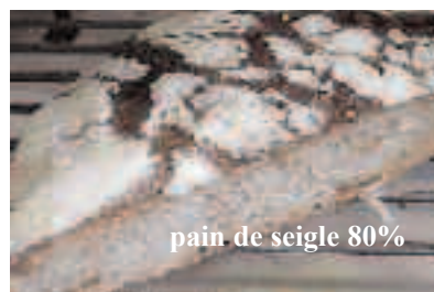
pain de seigle 80%